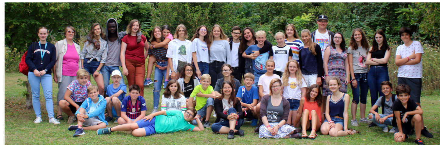
Jeunes Gersthofer et Nogentais à Nogent, août 2019