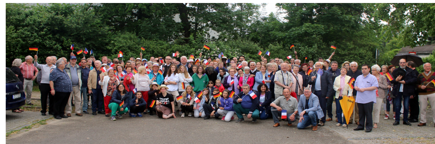
50 ème anniversaire à Gersthofen